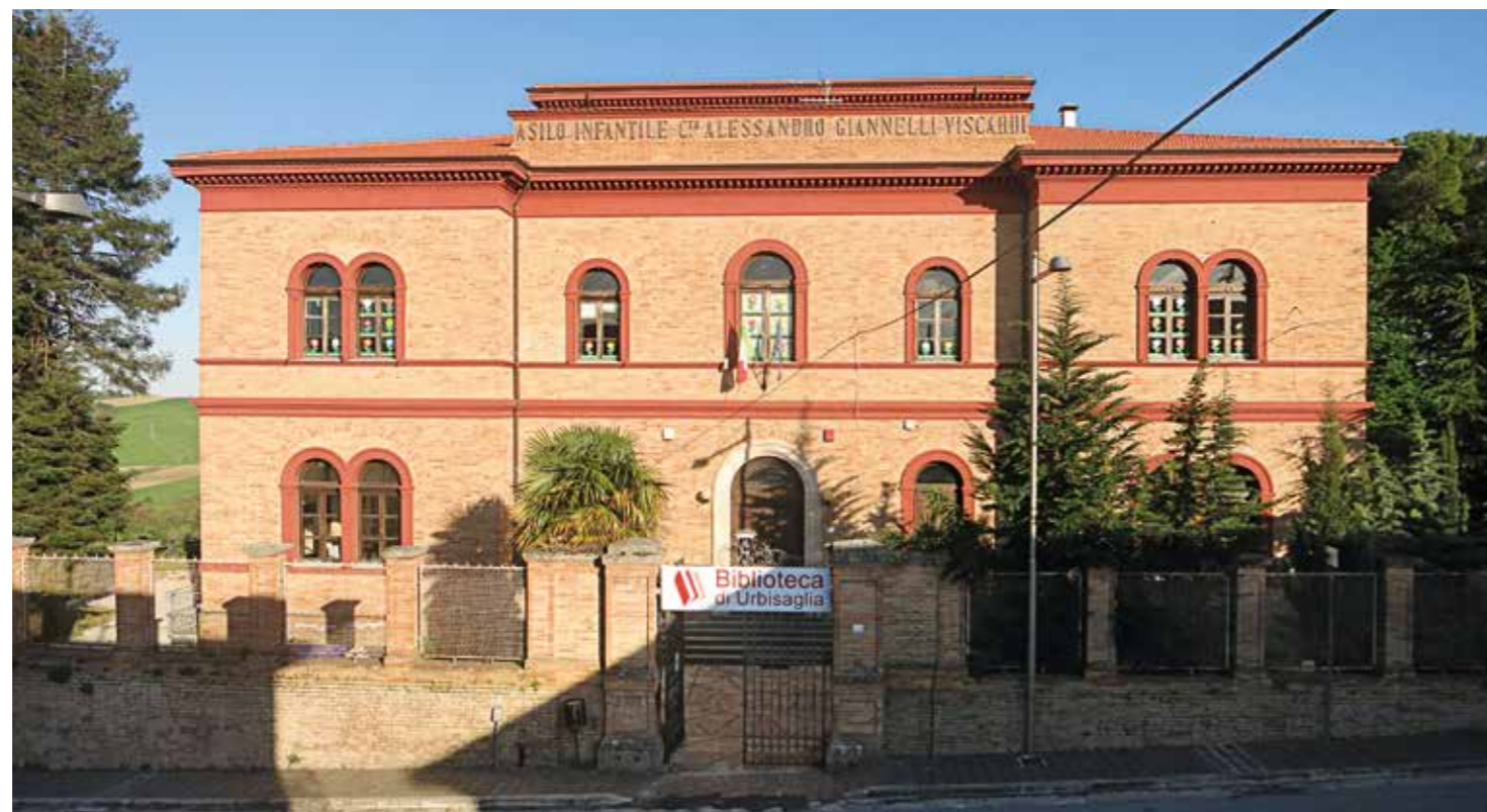
L'Asilo Giannelli di Urbisaglia, sede della Biblioteca

Oltre a tutto questo forniamo alcuni interessanti servizi: l'accesso gratuito a Media Library On Line , che garantisce innumerevoli contenuti digitali; le pagine informative